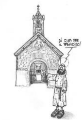
1246 - PERDONO di Assisi

È un’indulgenza plenaria (remissione dinanzi a Dio della pena temporale per i peccati, già rimessi quanto alla colpa, che il fedele, debitamente disposto e a determinate condizioni, acquista per intervento della Chiesa) che può essere ottenuta in tutte le chiese parrocchiali e francescane dal mezzogiorno del 1° agosto alla mezzanotte del 2 e tutti i giorni dell’anno visitando la Chiesa della Porziuncola di Assisi dove morì San Francesco. Il Poverello ottenne l’indulgenza da papa Onorio III il 2 agosto 1216 dopo aver avuto un’apparizione presso la chiesetta